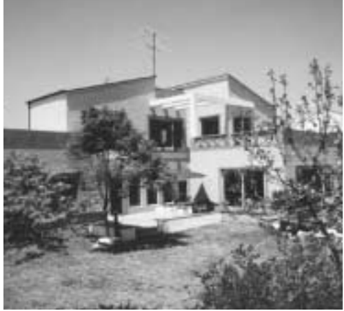
경기도가 주거의 질 향상을 위해 주택조례 제정안을 마련한다.

경기도는 그동안 부족한 주택을 대량공급하기 위해 운영되던 주택건설촉진법이 주거복지 및 환경·주택관리 부분이 보강된 주택법으로 대체되고 시행령이 운영됨에 따라 주택법령에서 시·도의 조례로 정하도록 위임한 사항과 그 시행에 관하여 필요한 사항을 정하기 위해 경기도 주택조례 제정안을 마련하여 10