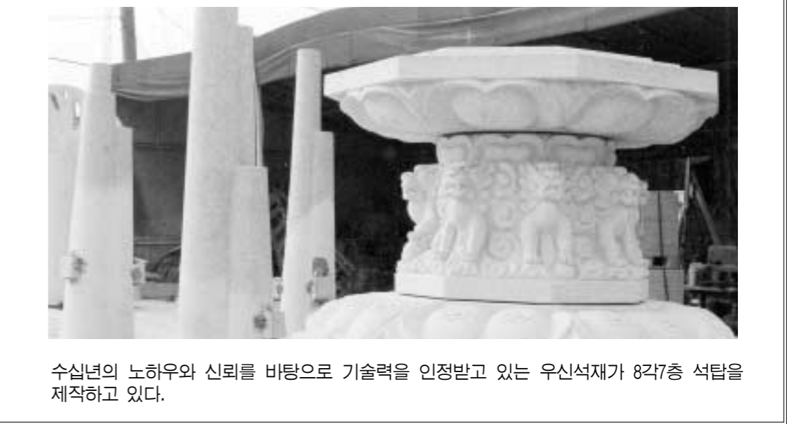
수십년의 노하우와 신뢰를 바탕으로 기술력을 인정받고 있는 우신석재가 8각7층 석탑을 제작하고 있다.

높이 15M, 3M)의 석재 조각품을 제작중에 있다. 하지만 유영술 소장에게는 한가지 약점이 작용하고 있어 하청만을 위주로 공사를 하고 있지만 협력업체로부터 높은 기술력과 신뢰를 인정받아 조형물 제작에 있어서는 관내에서 60%이상을 하청받아 철저한 관리하에 공사를 진행하고 있다. 또한 유영술 소장은 "넓은 부지(2300여평)를 작품전시관과 석공물, 조형물 보관, 철거, 대행까지 할 수 있는 공간으로 적극 활용할 계획을 준비하고 있다"며 "포천시에서 준비중인 아트밸리 조성사업이 포천의 아름다운 자연경관과 어울릴 수 있는 공원과 모든 시민들로부터 사랑받을 수 있는 공간으로 탄생되길 바란다"고 덧붙였다. 특급 기술력과 신뢰를 바탕으로 자만하지 않고 묵묵히 작업에 몰두하고 있는 유영술 소장의 모습에서 참다운 조각 예술가 영혼이 가미된 작품세계를 읽을 수 있었다. 문의 031)536-0457, 011)9948-4027 정병갑기자 jpk61@paran.com