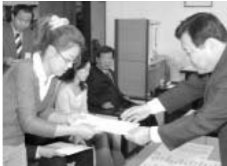
7일 포천시청 부시장실에서 주민세 성실납부자 경품전달식이 개최됐다.

포천시는 7일 부시장실에서 전 산추첨을 통해 당첨된 2004년도 정기분 주민세 성실납부자에게 경품을 전달했다. 포천시는 지난