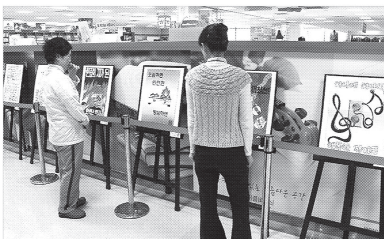
자라나는 어린이들의 화재예방 불조심 작품을 홈플러스 송우점에 1월20일부터 28일까지 전시했다.