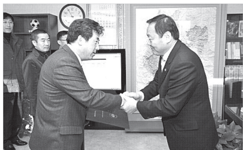
포천시는 가축 전염병이 유입되는 것을 예방하기 위해 가축별 전문 수의사 8명을 위촉했다.