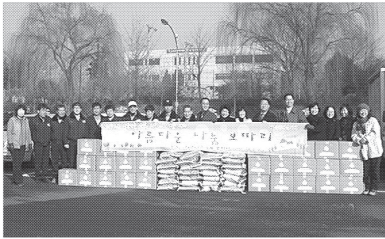
아름다운 가게 포천점은 1월19일 포천실내체육관 앞에서 포천시모범운전자회 회원 20여명과 아름다운 가게 천사 20여명 등 40여명이 희망나눔보따리 행사를 실시했다.