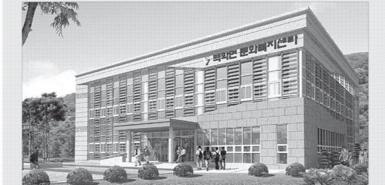
연천군은 1월23일, 백학면 주민들의 오랜 숙원사업인 문화복지시설 신축공사를 착공했다.

신축되는 문화복지시설은 오는 7월19일 완공 예정으로 사업비 7억7천6백만원을 투입하여 연면적 981.6㎡, 지상 2층 규모로 건축된다. 1층은 마을주민들의 여가생활을 지원하기 위한 취미교실 및 소회의실이 들어설고, 2층은 체력단련실 및 대회의실 등이 각각 들어설 예정으로, 주민들을 위한 문화 복지 및 여가선용, 정보교환의 공간으로 활용될 전망이다. 이준학 기자 blsoccer@naver.com