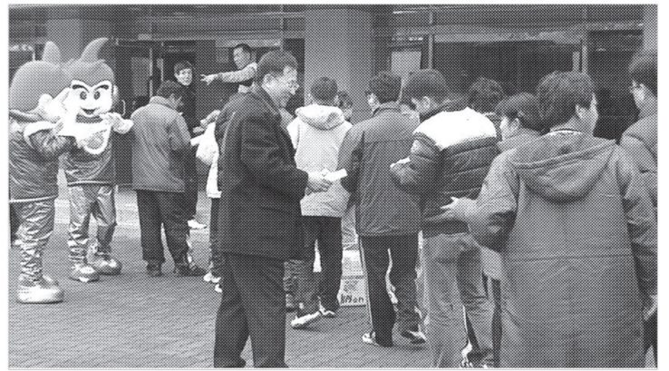
연천군선거관리위원회는 1월19일부터 2월22일까지(35일간) 설·대보름을 전후한 특별예방활동 및 감시·단속을 추진한다고 밝혔다.

연천군선거관리위원회에 따르면 4월8일 실시하는 경기도교육감선거 이후보 예정자는 물론, 국회의원·지방자치단체장·지방의회의원 등이 설·대보름을 전후해, 금품·음식물 등을 제공하는 행위나 사전선거운동 및 기부행위가 발생하지 않도록 사전에 충분히 안내하고 감시·단속 활동을 강화하여 공명선거문화를 정착시킨다고 밝혔다.