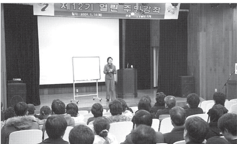
연천군은 주민들에게 열린 교육과 평생학습의 기회를 제공하는 연천 로하스 대학을 4월부터 운영할 계획이다.