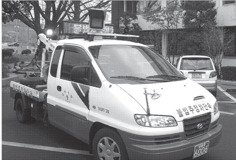
연천군은 3월1일부터 첨단 CCTV와 컴퓨터가 장착된 차량탐재형 불법주정차 단속 CCTV를 활용해 단속을 실시한다.

도 같은 위치에서 재촬영될시 불법주정차 차량으로 간주, 과태료를 부과하게 된다. 군은 우선 이 달 말까지 시험가동을 통해 홍보 및 계도를 집중적으로 실시하는 한편, 단속된 차량에 대해서는 경고장을 발부해 주민들에게 경각심을 고취한 후, 오는 3월1일부터 본격적인 단속을 실시할 예정이다. 또한 차량탐재형 불법주정차 CCTV 단속계획 홍보를 위한 현수막을 게시하고 군 홈페이지를 통한 홍보를 강화하여 단속으로 인한 민원을 최소화 할 계획이다.