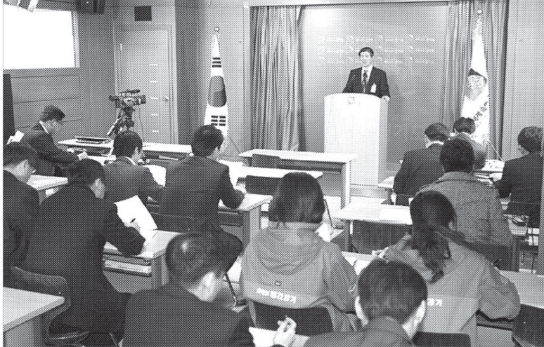
경기도가 강도 높은 예산 절감을 위해 신설한 계약심사담당관실이 운영 4개월만에 1천200억원이 넘는 사업비 절감 효과를 거둔 것으로 나타났다.