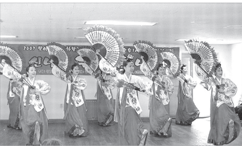
(사)한국무용협회 의정부지부는 10월26일 오전9시부터 의정부예술의전당 대극장에서 제10회 회룡한국무용제 전국대회를 개최한다.

경기도선수단은 10월17일 개선하여 오후 3시에 김문수 도지사(수중 3, 수영 1)의 한국신기록과 역도의 장미란 선수 등 3관왕 4명, 수중의 수원시청 최재룡 선수 등 2관왕 28명을 배출했다. 김도지사에게 총감독인 경기도체육회 한영구 사무처장이 우승기, 우승배 봉납과 함께 단기를 반납받고 체육용도 경기도를 빛낸 선수단에 노고를 치하했다. 김영복 기자 best114@paran.com