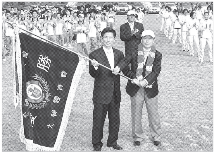
전국체전 종합우승 경기도선수단 환영식이 10월17일 오후 경기도청 운동장에서 김문수 경기도지사를 비롯 진중실 경기도의회 의장, 각급기관장, 선수, 선수가족, 공무원이 참석한 가운데 개최했다.

경기도가 전라남도 여수시 일원에서 개최된 제89회 전국체육대회에서 8만3천421점을 득점해 역대 최다득점을 기록하고 2002년 제83회 제주대회 이후 종합우승 7연패를 달성했다. 이는 1970년 이후 최초의 7연패 달성이며 기록면에서도 전국체전 사상 최초의 8만점 돌파와 역대 가장 많은 149개의 금메달(은138개, 동147개)을 획득하는 등 각종 기록을 경신하는 성과이다.