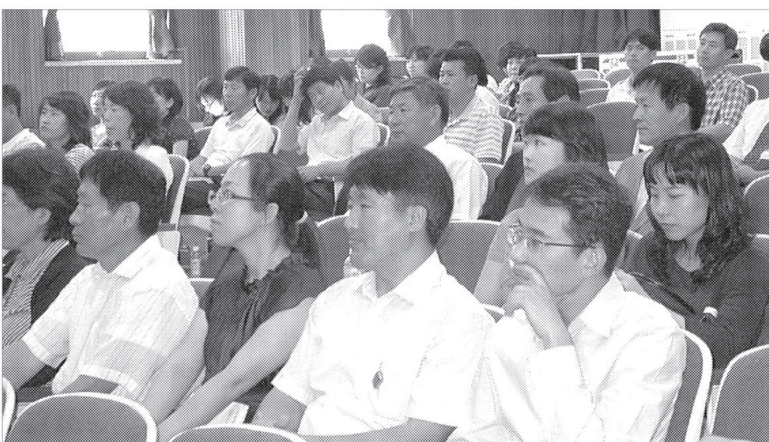
경기도연천교육청은 9월17일 연천군청소년수련관 대강당에서 연천 관내 중학교 교사 전체(108명)를 대상으로 '2007년 개정교육과정'의 현장 적용에 대비한 연수를 실시했다.