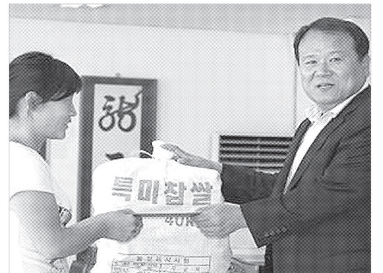
양주경찰서와 양주경찰서 보안협력위원회는 9월12일 추석을 앞두고 북한에서 자유를 찾아 국내 입국하여 거주하고 있는 새터민들과 추석명절을 함께 하는 마음을 담아 각 세대당 쌀1가마니와 상품권(10만원)을 전달했다.