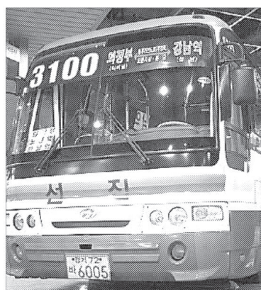
포천시와 선진고속(주)은 9월1일부터 포천 대진대~서울 양재역을 연결하는 직행좌석버스 3100번을 운영한다.

포천시 관계자는 “금년 말 포천동 지역으로까지 노선을 연장할 계획”이라며 “이를 계기로 더 많은 시민이 편리하게 대중교통을 이용할 수 있을 것”이라고 밝혔다.