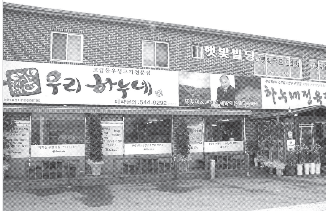
포천시 설운동 16-3번지에 위치한 우리하누네 전경(예약031-544-9292, 체인사업본부031-543-0399)