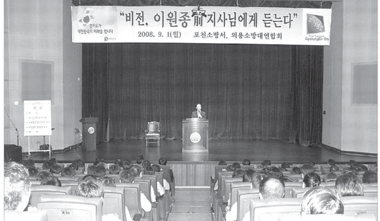
포천소방서는 9월1일 포천반월아트홀에서 이원종 전 충북도지사를 초청해 '비전, 이원종 전 지사에게 듣는다'라는 주제로 공직사회의 중요성에 대하여 특강을 실시했다.