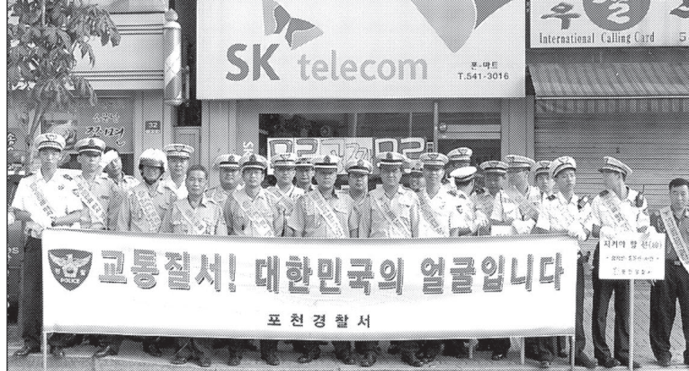
포천경찰서는 9월9일 송우리 시내에서 교통질서 캠페인을 개최했다.