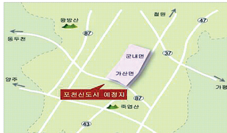
포천시가 추진중인 신도시예정지역.

서장원 시장 “1차 70만평 부터 단계별 추진 중” 김영우 국회의원 “주공의 보고를 받아 면밀하게 검토 중” 이종호 시의장 “승인받은 150만평 차질없이 추진해야”