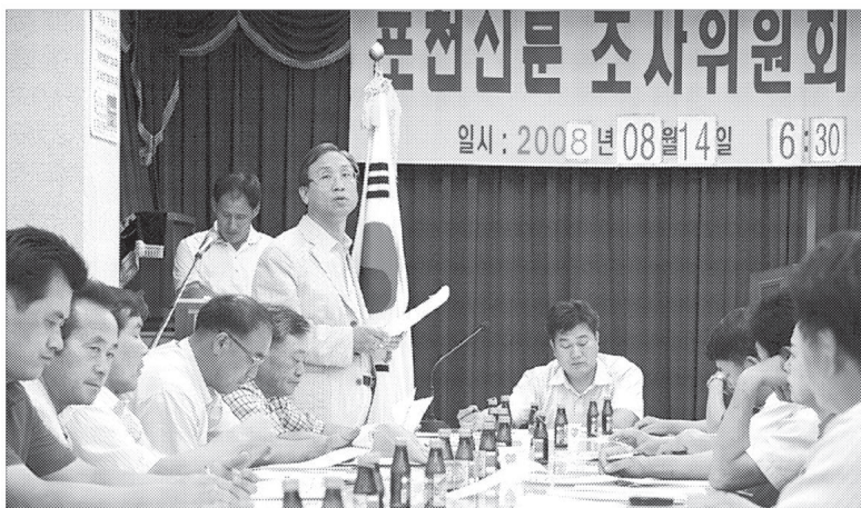
포천신문 조사위원회는 8월14일 포천신문사 대회의실에서 제35차 정기회의를 개최했다.