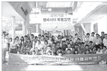
연천교육청 부설영재교육원은 영재교육원생 54명을 대상으로 8월4일부터 6일까지 2박3일 동안 광주광역시 및 대전광역시 일대에서 2008 영재교육원 여름과학캠프를 실시했다.

둘째 날은 영주체육관 및 빛고을 체육관에서 진행되는 60여개 부스의 흥미로운 과학 체험 프로그램에 참여하며 즐거운 시간을 보냈다. 회전하는 필름통 만들기, 마술 카메라, 나만의 양초만들기 등