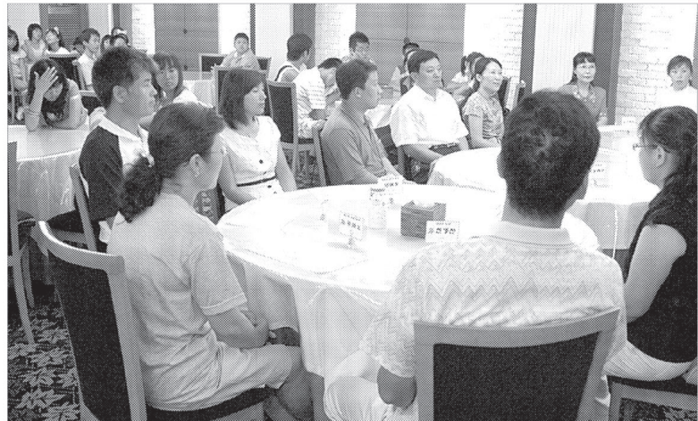
연천군은 8월12일, 민간교류 확대와 국제화 마인드 함양을 위해 학생교류단을 구성해 4박5일간의 일정으로 자매결연 도시인 중국 추성시를 방문했다.