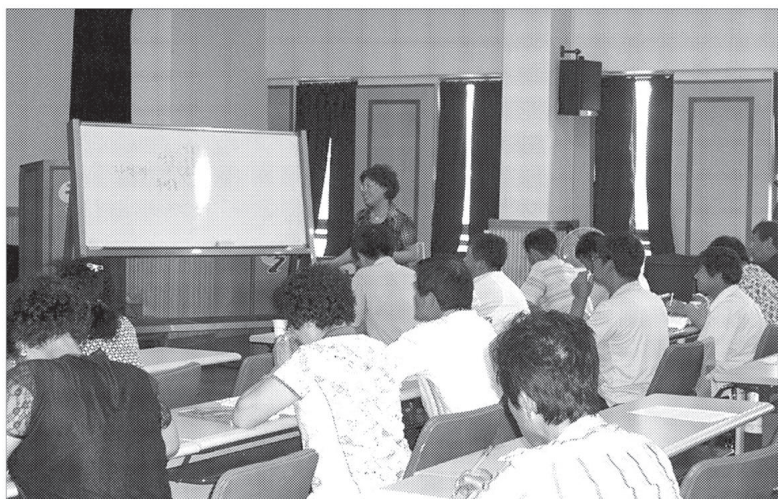
연천군은 21세기 연천농업을 이끌어갈 유능한 인재를 발굴, 집중 교육하여 전문기술과 경영능력을 겸비한 선진기술의 농업 선도자로 양성하기 위해 지난 3월25일 입학식을 개최했다.