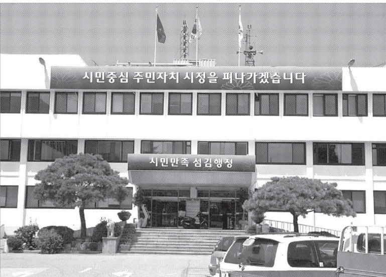
포천시는 2008년 정부조직개편 방향과 부합하고 포천시 정책기조가 잘 반영된 시민중심의 행정조직 구성을 통해 시민의 가치를 우선하는 포천을 지향하기 위해 시민중심 조직개편안을 마련했다고 밝혔다.

건설도시국은 5과25담당으로 ▶건설과(건설행정, 도로, 광역, 지역개발, 생활민원처리팀) ▶재난관리과(재난관리, 민군협력, 복지지원, 하천, 민방위) ▶도시건축과(도시건축행정, 도시계획, 도시시설, 공공건축, 건축, 도시미관) ▶교통행