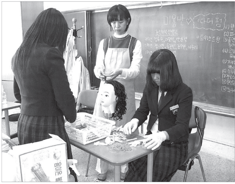
포천시 여성회관에서 운영 중인 벤처꿈나무대학이 관내 청소년들에게 교과 중심의 활동을 탈피한 보다 실용적인 프로그램을 제공해 호응을 얻고 있다.