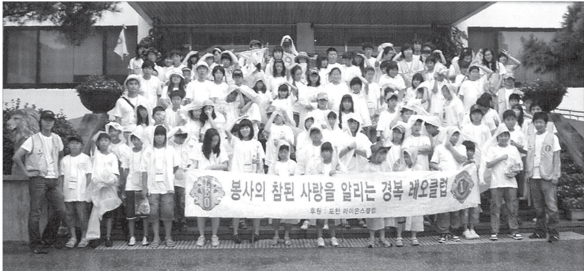
매년 포천시 초등학교 학생들과 함께 하는 행사인 경북레오클럽 제3회 하계봉사가 8월3일부터 5일까지 많은 관심과 성원 속에 진행됐다.