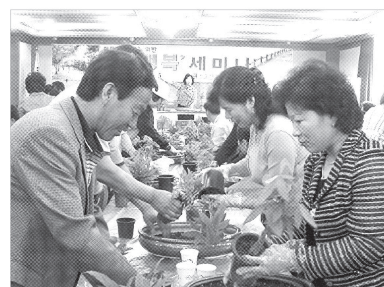
포천시 농업기술센터는 8월22부터 8월23일까지 1박2일간 포천시 내촌면 베어스타운에서 부부행복 세미나를 개최한다.