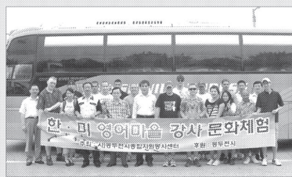
동두천시종합자원봉사센터는 동두천 한미 영어마을 영어회화반의 강사로 수고한 미2사단 포병여단 미군 35여명을 7월19일 용인에버랜드로 안내해 한국문화를 체험 하도록 했다.

동두천시종합자원봉사센터(이사장 오세창)는 동두천 한미 영어마을 영어회화반의 강사로 수고한 미2사단 포병여단 미군 35여명을 7월19일 용인에버랜드로 안내해 한국문화를 체험 하도록 했다.