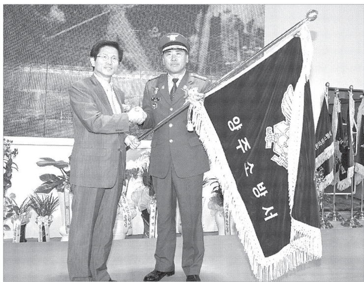
김문수 경기도지사는 7월24일 양주시 백석읍에서 양주소방서 개청식을 갖고, 취임 2년 만에 소방서가 없던 의왕시 ▶가평군 ▶화성시 ▶연천군 ▶양주시에 소방서 개청을 완료했다. 상 4층 규모의 양주소방서 신축 공사를 마무리하고 소방관계자, 주민 등 1천500여명이 참석한 가운데 준공식을 가졌다. 방송인 임재무 씨가 경주소방 홍보대사로 임명되기도 했다.

경기도에 1시군 1소방 시대가 활짝 열렸다. 김문수 경기도지사는 7월24일 양주시 백석읍에서 양주소방서 개청식을 갖고, 취임 2년 만에 소방서가 없던 의왕시 ▶가평군 ▶화성시 ▶연천군 ▶양주시에 소방서 개청을 완료했다.