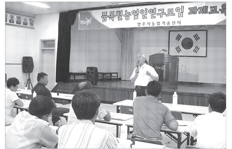
양주시 농업기술센터는 양주에서 생산된 우수 농축산물을 포장재 개발 등으로 규격화, 표준화하여 상품성을 제고하고자 품목별 연구회양주시연합회인원, 관계자 등 60여명을 대상으로 7월18일 과제교육을 실시했다.

또한 농업인들의 여름철 건강관리를 위한 천연 모기퇴치제를 만들어보는 시간도 가졌으며, 특히