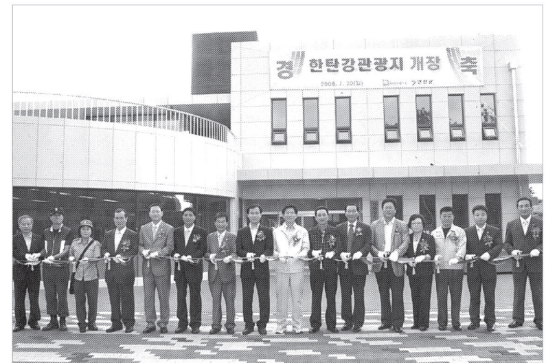
연천군은 7월19일, 전곡읍 전곡리 630번지 일원의 31만2000㎡ 부지를 대상으로 2005년 1월부터 올해 6월까지 199억원을 투입해 연천의 풍부한 역사문화 자원과 안보생태자원 등 가능성을 바탕으로 지역개발과 지역경제 활성화를 계기를 마련하고자 추진한 한탄강관광지를 개장했다.

한탄강관광지는 취사장, 화장실 4동, 주차장 등을 내용으로 하는 공공편익시설(6만9천314㎡)과, 다목적운동장, 어린이캐릭터원, 건강지압원, 청소년 축구장, 다목적 청소년 마당 등을 주요시설로 하는 운동오락시설(5만10069㎡),오로캠핑장, 다목적광장, 조정휴게지 등을