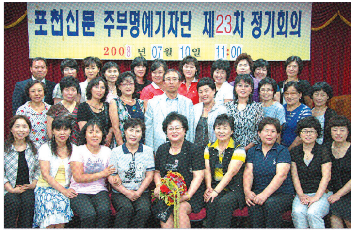
포천신문 주부명예기자단은 7월10일 제23차 정기회의를 개최하고 임원개선에 관한 건을 처리했다.

이날 선출된 제5대 임원은 2008년8월1일부터 2009년7월31일까지 1년간 활동하게 된다. 다음은 임원 명단이다. ▶단장 박혜자 ▶부단장 김미경 ▶부단장 김순희 ▶상임고문 김영복 ▶고문 김기호 ▶고문 임경순 ▶감사 용경자 ▶총무 박서영 ▶부총무 신델라 ▶부총무 김미숙 ▶이사 강옥자 ▶이사 이은미 ▶이사 노훈식 ▶이사 김명희 ▶이사 김진숙 ▶이사 이효정 ▶이사 조장희 ▶이사 권귀자 ▶이사 이종실 ▶이사 김옥남 ▶이사 신형숙