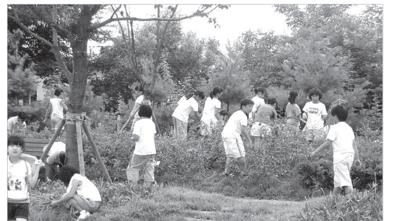
군남초등학교는 7월12일 60명이 참가한 가운데 ‘나룻배 마을’에서 특별한 토요일 체험활동을 실시했다.

군남초등학교는 7월12일 60명이 참가한 가운데 ‘나룻배 마을’에서 특별한 토요일 체험활동을 실시했다. 나룻배 마을은 폐교된 북삼분교를 지역 사람들이 마을 체험학습장을 꾸미고, 학생과 가족들이 체험활동을 할 수 있도록 만든 곳이다. 이번 행사는 토요일업일 협력학교인 군남초등학교에서 지역사회와의 인프라 확충과 협력 체제를 강화하고 학생들의 애호심을 기르며 나아가 체험활동을 통한 학생들의 자기 주도적인 역량을 강화하기 위해 마련됐다. 이번 체험활동은 전교생의 약 50%인 60명의 어린이들이 참가하여 높은 참여율을 보였다. 나룻배 마을에 도착한 아이들은 가마솥에서 갓 쪄낸 감자로 든든하게 체험활동을 위한 준비를 한 뒤, 각자 봉지마다 호미와 장갑을 받아 들고는 감자밭을 향했다. 밭이랑을 따라 감자 캐는 요령을 듣고는 너도나도 감자를 캐기 시작하였는데 호미질을 따라 알 굵은 감자가 데굴데굴 나올 때마다 아이들의 환호성이 터졌다. 두 번째의 행선지는 허브 빌리지 마을로 나룻배 모양을 뒤에 단 트랙터 위에 올라타서 동생들을 무릎에 앉히고도 자리가 비좁았지만 허브빌리지까지 가는 동안 웃음이 끊이지 않았다. 허브 빌리지에는 평소 잘 보지