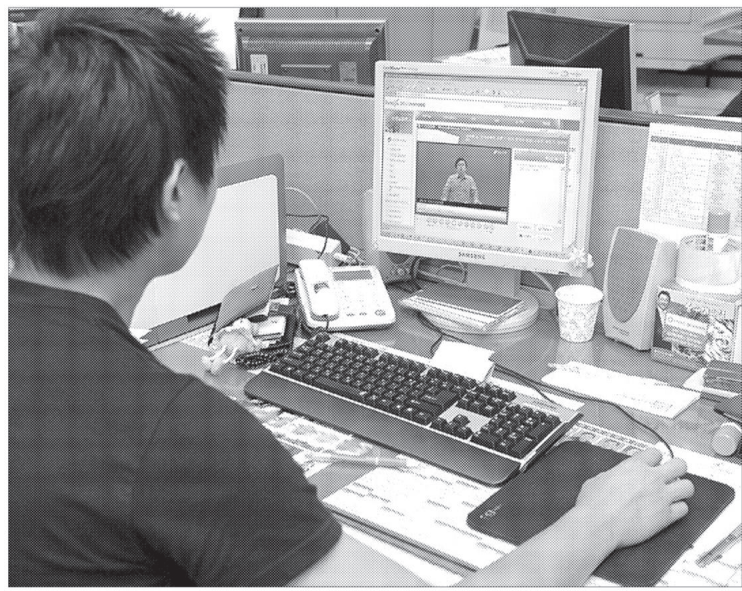
양주시는 사교육비로 인한 학부모들의 경제적 부담을 덜어주고 관내 고등학교 수험생에게 수준 높은 학습기회를 제공하기 위해 5월7일 강남구와 협약을 맺고 홈페이지를 구축하여 7월 1일부터 양주시 인터넷 수능방송 서비스를 시작했다.

이용 방법은 인터넷 주소 http://study.yangju.go.kr 로 접속하거나 양주시 평생학습센터 홈페이지( http://ll.yangju.go.kr )에서 양주시 인터넷 수능방송을 클릭하여 『회원등록 후 이용』하면 된다. 또한 양주시는 정회원 가입자 수 10% 범위 내에서 기초 생활 보장 수급 자를 선정, 가입비를 면제해 주기로 강남구와 협의하고, 2009년부터는 정회원 가입비 50%(1만원)를 지원할 방안도 계획하고 있다. 강호습 주민생활지원과장은 시민과 함께 하는 교육심포니 도시 양주 건설을 위해 구축한 인터넷 수능방송을 이용하여 많은 학생들의 학력 신장에 도움이 되기를 기대한다고 말했다.