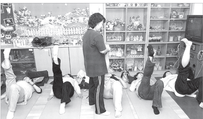
양주시 보건소는 산모들이 건강하고 예쁜 아기의 출산을 위하여 전통 한방섭생을 접목한 한방 산전, 산후교실을 운영한다.

양주시 보건소는 산모들이 건강하고 예쁜 아기의 출산을 위하여 전통 한방섭생을 접목한 한방 산전, 산후교실을 운영한다. 한방 산전산후 교실은 임신 20주 이상 임신부 25명을 대상으로 산전산후강의, 임신부운동과 구강교육 및 검진, 사상체질진단, 산전산후 한방 양생법, 산후 우울증에 대한 특강교육을 무료로 실시한다. 운영은 8월25일부터 10월6일까지 보건소 나누리 방에서 매주 월요일 오전 9시부터 11시까지 주1회 총 6회에 걸쳐 운영된다.