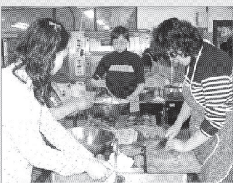
양주시 농업기술센터 홈 베이커리교육 과정의 참가 교육생들이 주위의 어려운 이웃에게 나눔의 실천을 하고 있다.

양주시 농업기술센터는 다양한 역할확대에 따른 수행능력 배양으로 능력 있는 농촌 여성을 양성하고자 홈 베이커리교육 과정을 운영하고 있는데 참가 교육생들이 그동안 배운 제빵 기술을 활용하여 주위의 어려운 이웃에게 나눔의 실천을 하고 있어 귀감이 되고 있다. 4월 1일부터 7월 8일까지 15회에 걸쳐 25명의 관내 부녀자들이 매주 화요일 농업기술센터 생활 과학 실습실에서 당근 카스테라, 와인머핀 등 16종의 빵과 과자류 만드는 과정을 수료했다.