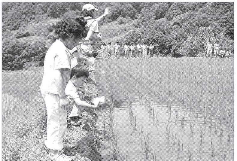
포천낙농영농조합법인은 6월12일 포천시 영북면 소회산리에 밀크스쿨을 열고 우유학습장으로 시민들에게 공개하고 있다.(사진은 우렁이 유기농 현장에서 학생들이 체험하고 있다.)

한편, 포천낙농영농조합법인은 2004년8월19일 지역의 10개 낙농가들이 우유생산단으로는 타산이 맞지 않아 1개 낙농가 당 1천만원씩을 출자하여 설립한 이후 2005년1월 회원4명이 이스라엘에서 소변호 스템프를 전수 받았으며 2007년부터 우성사료, 포천, 연천, 철원의