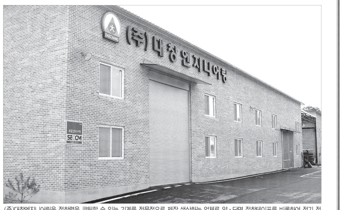
(주)대창엔지니어링은 점착력을 코팅할 수 있는 기계를 전문적으로 제작 생산하는 업체로 양·단면 점착테이프를 비롯하여 전기 전자 분야의 크린룸 설비에 의한 특수제품의 코팅 등 코팅기와 주변기기를 제작 생산하고 있다.