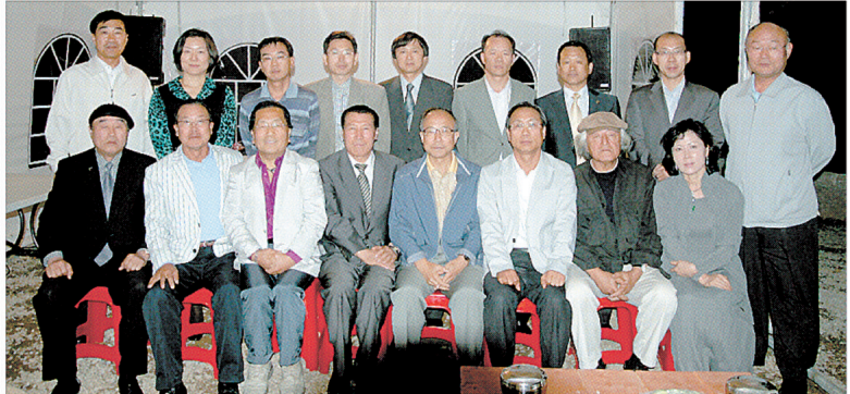
6월 3일 제25차 정기회의 겸 워크숍을 신정호수 프라임리조트에서 가졌다.