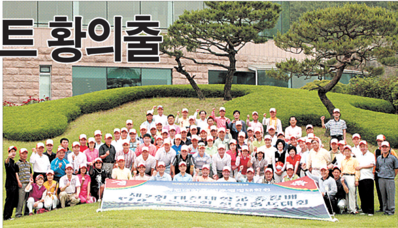
대진대학교 총장배 법무행정대학원 CEO 최고경영자과정 총동문회 친선골프대회가 포천아도니스 CC에서 개최됐다.

이날 대회는 18홀 스트로크&신 페리오 방식으로 진행됐으며 100명의 동문이 참가해 실력을 겨뤘으며 아도니스 CC 서코스 9호, 중코스 8호, 동코스 8호가 동시 티업