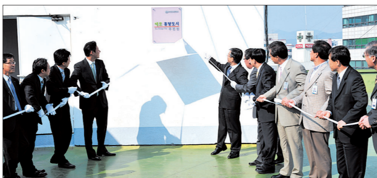
포천시는 4월24일 포천에코휴양도시 추진단 현판식을 가졌다.