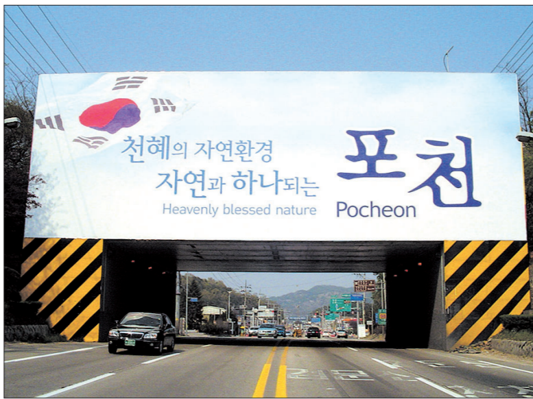
포천시는 소흘읍 이동교리 의정부시 간 경계에 위치한 축석 방호벽 이미지를 교체했다.