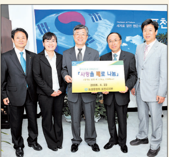
농협중앙회 포천시지부는 4월23일 포천시청을 방문해 관내 노인시설과 장애인 시설에 전달해 달라며 420만원 상당의 배 150박스를 기탁했다.