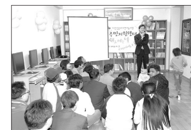
대한성공회 포천나눔의 집 이주민지원센터가 포천시 신음동 160-7번지로 이전하고 개소식을 4월13일 오후3시에 가졌다.

생활상담을 하고 있으며 교육, 의료, 문화 활동을 지원하고 각 국가별 공동체 조직 활성화를 도와주고 있다.