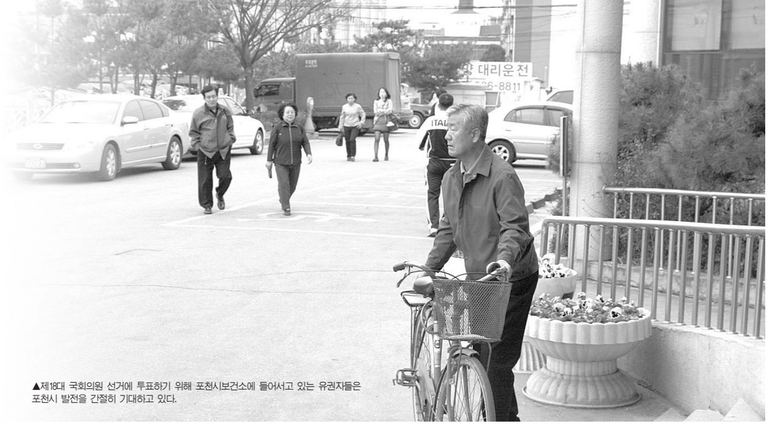
▲제18대 국회의원 선거에 투표하기 위해 포천시보건소에 들어오고 있는 유권자들은 포천시 발전을 간절히 기대하고 있다.