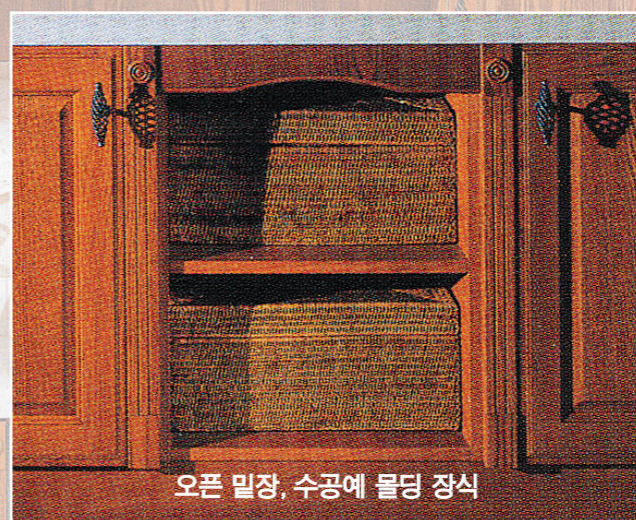
오픈 밀장, 수공예 물딩 장식