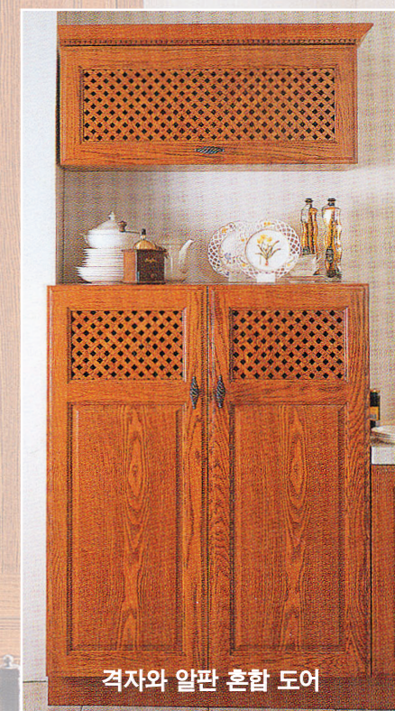
격자와 알판 혼합 도어