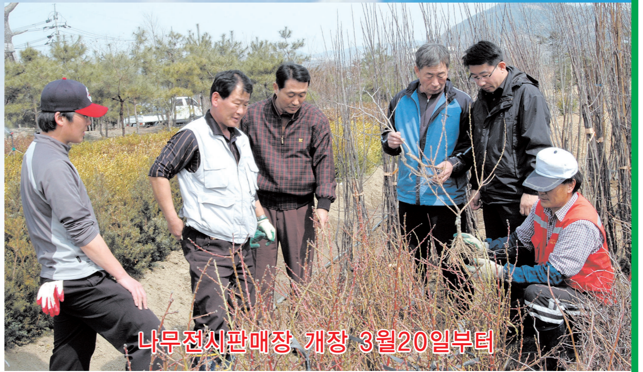
나무전시판매장 개장 3월20일부터

●소재지 : 포천시 신읍동 46-5 ●상담전화 : 532-7520, 534-7744