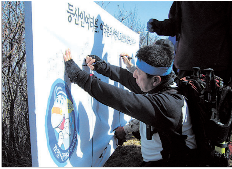
포천시전철유치위원회는 전철유치운동을 널리 홍보하고 직접 서명에 참여토록해 서명부의 역할도 동시에 하는 서명용 플래카드를 관내 주요 명산 정상에 설치할 계획이다.