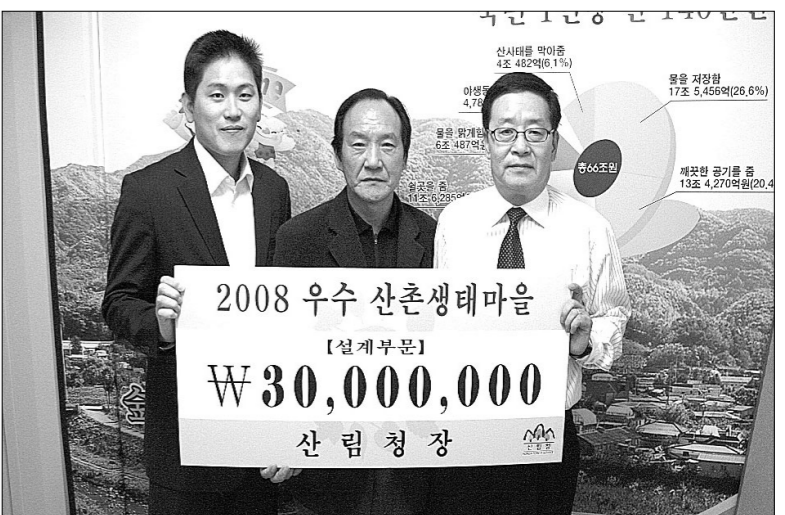
연천군은 2008 산촌생태마을 인센티브 평가에서 설계분야에서 우수마을로 선정돼 강원도 횡성군 내내면 청태산 자연휴양림에서 28일 개최된 '산촌생태마을 인센티브 평가 워크숍'에서 산림청장 표창과 3천만원을 지원받았다.

연천군은 2008년도 산촌생태마을 인센티브 중앙 및 도의 심사에 대한 객관성을 확보하고 우수 마을을 발굴, 인센티브 사업비를 지원하여 경쟁력과 자생력이 있는 지속가능한 산촌마을의 조성 및 육성에 목적을 두는 '2008 산촌생태마을 인센티브 평가'에서 설계분야에서 우수마을로 선정돼 강원도 횡성군 내내면 청태산 자연휴양림에서 28일 개최된 '산촌생태마을 인센티브 평가 워크숍'에서 산림청장 표창과 3천만원을 지원받았다. 2008년도 산촌생태마을 인센티브 평가는 경영우수, 조성우수, 설계우수 3개분야로 나누어 12개 마을을 선정하였고 분야별로 최우수 1개소, 우수 2개소씩 선정되었다. 산촌생태마을이란 낙후된 산촌을 살기 좋은 마을로 조성하자는 취지로, 전 국토의 40%를 차지하는 산촌의 산림을 어떻게 효율적으로 관리할 수 있을까? 이왕이면 산촌 주민들의 소득이 높아지고 도시민들이 편히 쉴 수 있는 산촌마을을 만들 수는 없을까? 하는 생각으로 추진해온 것이 산촌생태마을이다. 연천군은 산촌지역의 풍부한 산림과 휴양자원을 활용해 소득원을 개발하고 생활환경개선사업을 통해 낙후된 산촌을 살기 좋은 마을로 조성하기 위해 대관리에 조성한