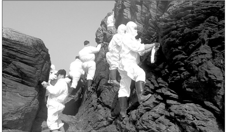
양주시 농업경영인회에서 지난 6일 태안군 원북면 자매결연마을에 대한 자원봉사를 실시했다.

고 간다고 말했다. 현지 담당공무원의 말에 의하면 자원봉사활동인원이 하루 100여 명씩 오고 있지만 갈수록 봉사인원이 줄어 걱정스럽다는 말을 전했다. 하승환 기자 forme65@paran.com