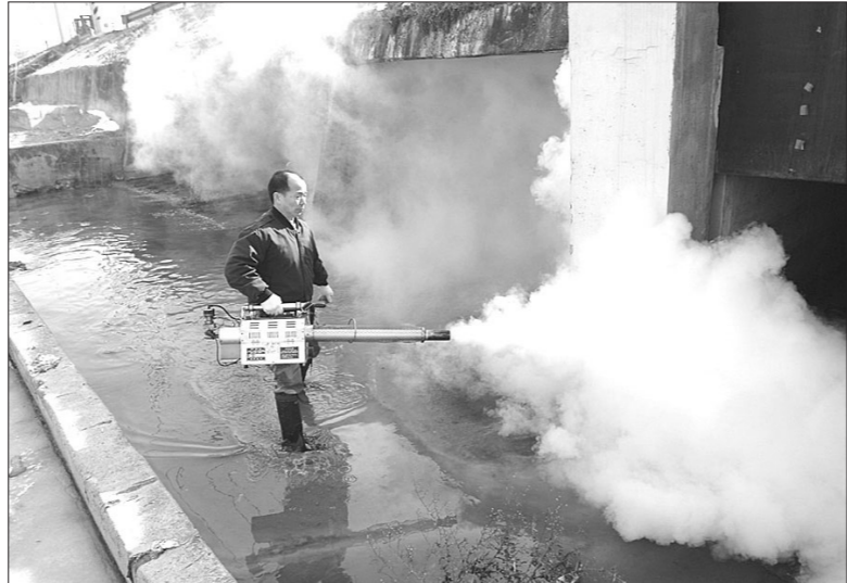
동두천시보전소는 지구온난화 현상으로 인해 계절에 관계없이 전염병이 발생할 뿐만 아니라 동절기 동안 모기가 죽지 않고 휴식을 취하다가 봄이 되어 날씨가 따뜻해지면 알을 낳아 번식한다는 것에 착안하여 동절기방역을 강화하고 있다.

는 방충망이 장착된 환풍기를 취약 지역에 설치하고 있다. 또한 겨울철에도 꾸준히 식중독이 발생하고 있으며, 겨울철에는 건조하여 여러 사람이 모인 장소나 곰팡이 등이 있을 경우 호흡기 질환을 유발할 수 있어 관내 노인정에 월2회 살균소독을 실시하고 있다. 동두천시보전소는 전염병으로부터 시민들의 건강을 지키기 위하여 최선을 다하고 있으며, 하수구 등에서 연기가 날 경우 화재로 오인하고 신고하는 사례가 있다며 시민들의 이해를 구했다. 김영복 기자 best114@paran.com