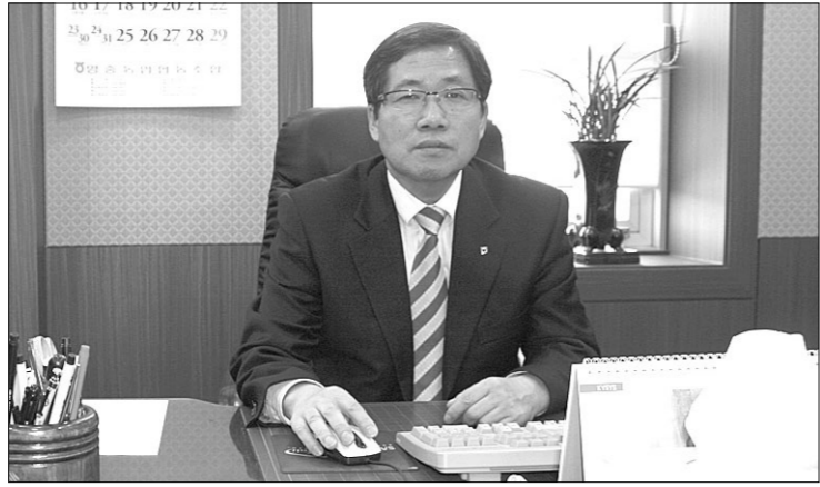
사실도 알게 되었다.

영중농협은 또 창구리모델링 이후 예산금의 증가 또한 상당히 빠르게 진행되고 있어 여러 어려움 속에서도 내일에 대한 분명한 목표와 희망을 가지고 있다면 위기는 기회로 승화 될 수 있다는