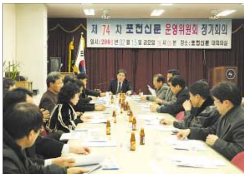
포천신문 운영위원회는 2월15일 오후7시 포천신문 대회의실에서 제74차 정기회의를 개최하고 2007년 연말결산 보고의 건 등을 처리했다.

추천하면 임원진에서 만나 전반적으로 의견을 교환 한 뒤 위촉여부를 결정할 수 있도록 하기로 했다. 운영위원 관리에 대해서는 또 김재명 위원이 “그동안 운영위원직을 중도에 그만 둔 위원들의 원인을 파악하여 대응하자”고 밝혔고 이희자 위원은 “영입도 중요하지만 그만 두지 않고 같이 갈 수 있도록 서로 노력하는 것도 중요하다”고 지적했다. 또한 앞으로 모든 재무에 관한 건은 임대섭 부총무가 맡기로 하고 월말 결산자료 이전에 임 부총무가 재무관계를 확인하고 회의자료를 작성하기로 의결하기도 했다. 회의를 마친후 관내 모 식당에서 식사를 하면서 운영위원들간의 화합과 친목의 계기를 마련하기도 했다. 김영복 기자 best114@paran.com