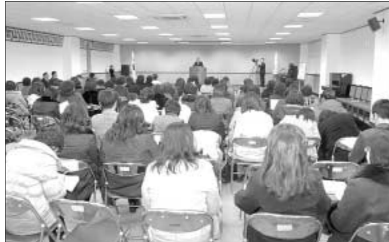
양주시는 2월14일 시청 대회의실에서 임춘민 양주시장과 관내 보육시설 시설장 200여명이 참석한 가운데 2008년도 보육사업 설명회를 가졌다.