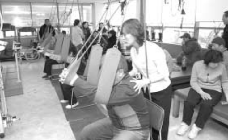
양주시는 HUB 건강증진사업 일환으로 주민대상 중풍슬링 운동교실 개회식을 2월18일 보건소 2층 건강증진실에서 개최했다.

HUB 건강증진 중풍슬링 운동교실은 사망원인 상위를 차지하고 있는 뇌병변으로 인한 중풍환자들 대다수가 운동의 중요성을 인지하