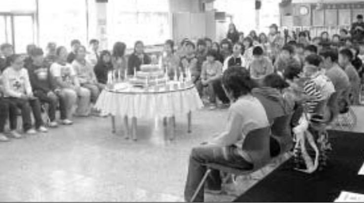
대광초등학교는 2월14일 학생과 학부모 200여명이 참석한 가운데 제53회 졸업식을 가졌다.