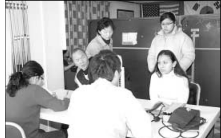
사회복지법인 라파엘클리닉은 2월17일 오전11시부터 살롱하우스에서 외국인 근로자를 대상으로 사랑의 의료 무료 봉사활동을 실시했다.

라파엘클리닉에서는 동두천시에서 지난해 10월부터 매월 첫째, 셋째 일요일을 정해서 의료 봉사활동을 전개하여 현재까지 150여명의 환자를 돌봐주고