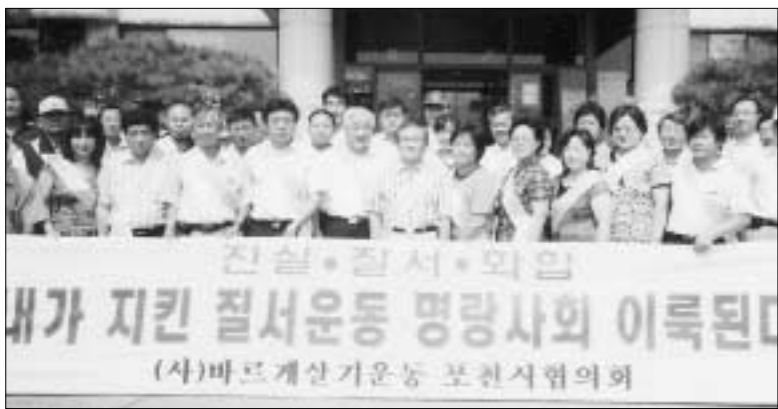
바르게살기 포천시협의회는 지난 24일 소홀음 송우리 민속장터에서 '친절질서 청결운동 생활화로 선진 문화시민이 됩시다'라는 전단지 2천매와 티슈 2천장을 시민들에게 배포했다.

바르게살기 포천시협의회는 지난 24일 소홀음 송우리 민속장터에서 '친절질서 청결운동 생활화로 선진 문화시민이 됩시다'라는 전단지 2천매와 티슈 2천장을 시민들에게 배포했다. 이번 청결운동 캠페인은 세계속의 경기도 구현과 바르게살기운동 전국화원대회 10월9일 수원시에서 성공리에 개최되고 포천지역을 4개 권역(포천, 영북, 일동, 소홀음)으