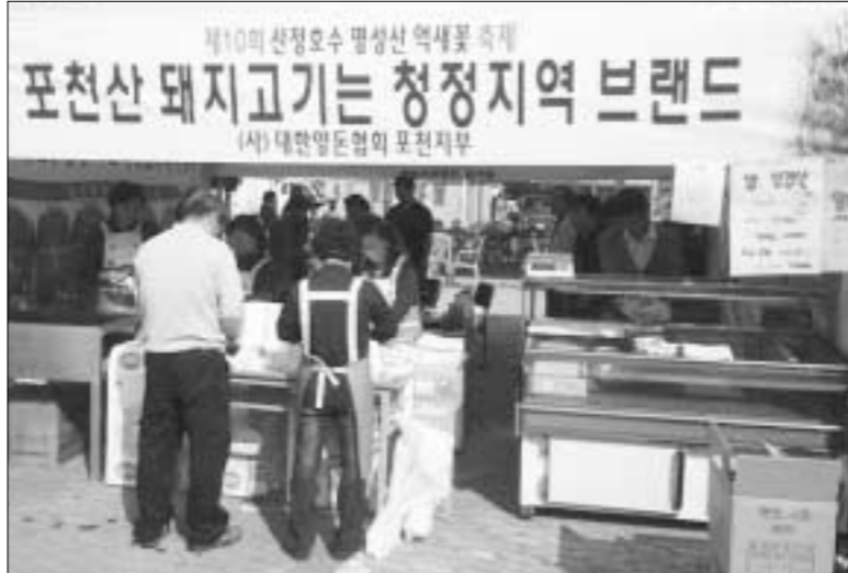
양돈협회 포천지부는 제 10회 산정호수 명성산 역사꽃 축제에서 포천산 돼지고기 시식회를 통해 축제를 찾은 관광객들에게 청정지역 브랜드 이미지를 제고했다

단체 종사자를 발굴해 회생정신을 계승하고 표창함으로써 양돈인의 위상을 높이고 지역발전에 공헌하는 양돈협회가 되도록 노력해 나갈 계획이다.