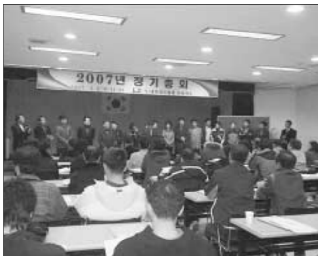
양돈협회 포천지부 회원들이 2007년 정기총회를 실시하고 있다