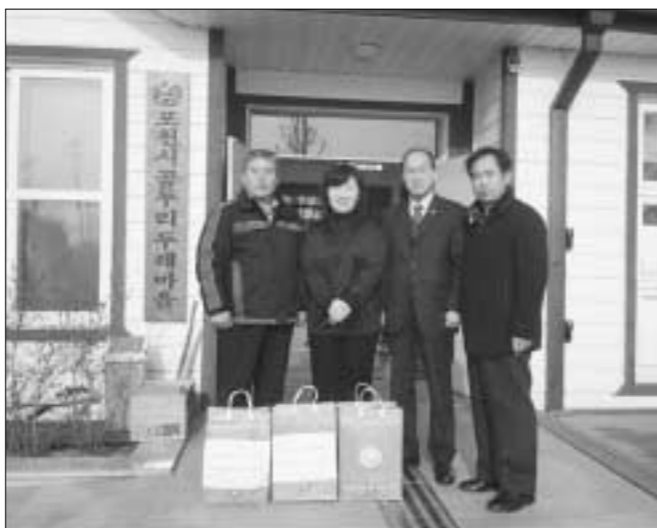
양돈협회 포천지부는 관내내 사회복지 시설을 방문하고 시설에 돼지고기를 전담했다