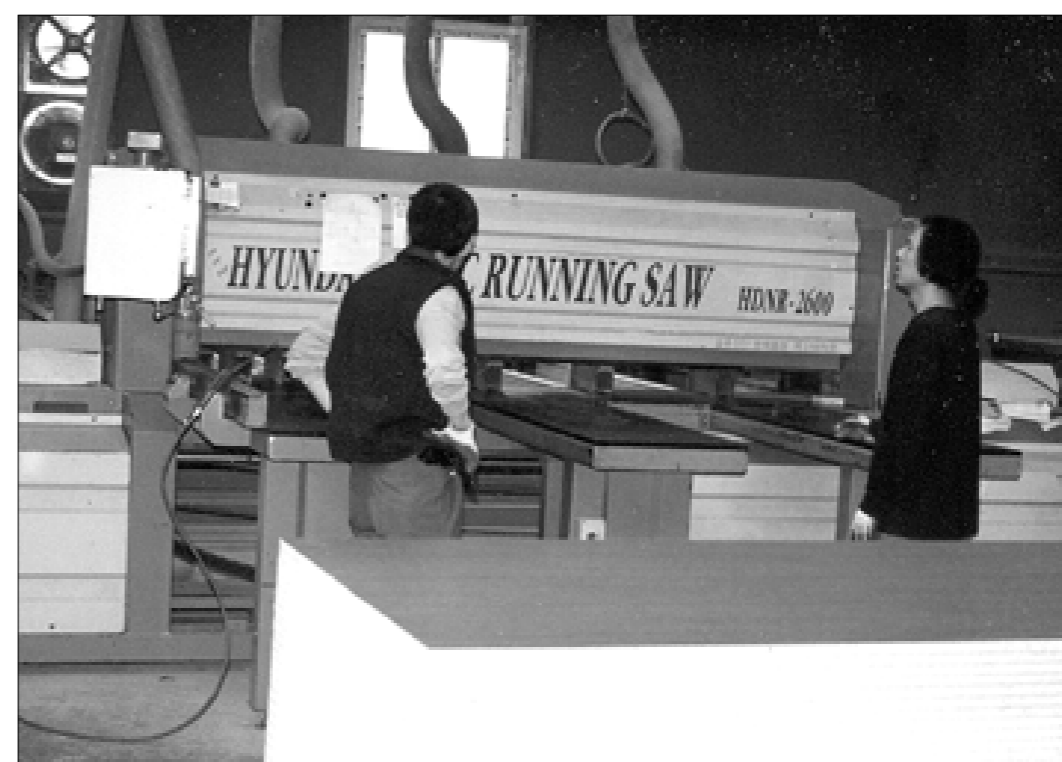
현대적 감각과 클래식한 분위기를 더한 공간연출로 고객을 만족시키고 더 나아가 고객을 감동시키고 있는 와이케이인더스트리

문의) T. 031-534-6854 F. 031-534-6882 3536 정병갑 기자 jpk61@paran.com