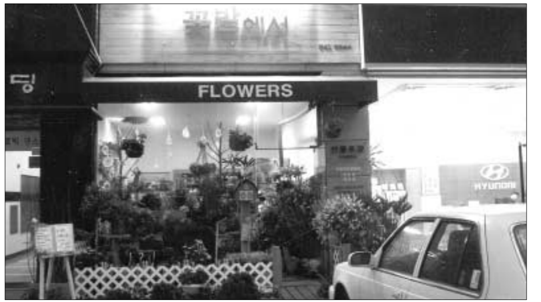
orst 공 리 정 제공 사

사람들에게 기쁨은 두 배, 슬픔은 반으로 줄여 주는 작품 만들기에 모든 노력을 아끼지 않고 있다. 현재 사랑이 피어나는 공간 꽃밭에서는 주거공간(베란다·거실), 옥상, 사무실, 음식점 등에 꽃과 식물을 소재로 한 친환경 실내정원을 조성해주고 있다. 꽃 내용과 풀 내용이 가득한 실내정원은 잠시나마 피로에 지친 현대인들에게 안락한 휴식공간으로 최적이라고 한다. Florist 형 원장의 풍부한 노하우와 타고난 감각을 앞세워 주위환경과 어울리는 실내정원은 자연을 잠시 담은 느낌이 들 정도라고 귀뜸 하고 있다. 사랑이 피어나는 공간 꽃밭에서 영업시간은 오전 9시 30분부터 오후 8시까지다. 문의, 031)541-9844 Hp 011)302-4593 정병갑 기자 jpk61@paran.com