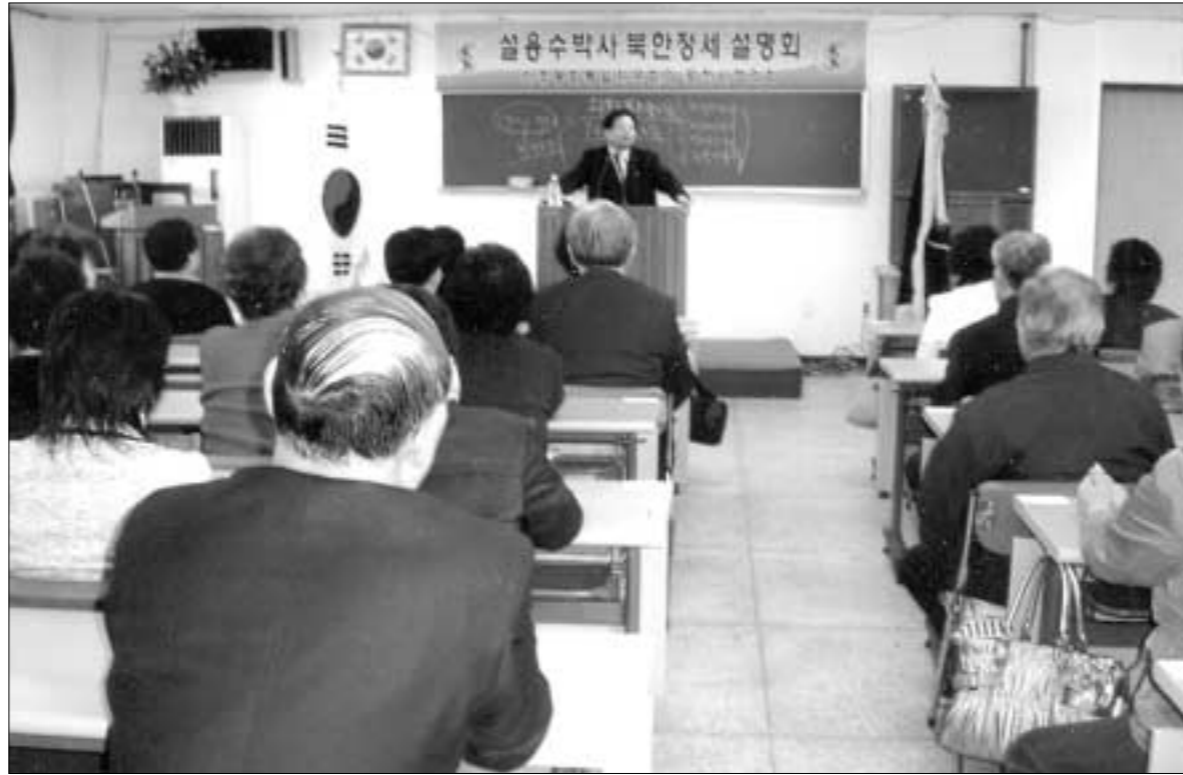
민주평화통일자문회의 포천시협의회는 3월23일 포천시 복지회관 2층 노인대학 강당에서 기관단체장과 자문위원, 포럼위원, 지도층인사 등 150명이 참석한 가운데 북한정세 설명회를 개최했다.

포천시협의회는 12기가 출범한 2005년7월1일 이후 매월 12일을 자 문위원간 친목도 다지고 화합과 단 결을 위하여 통일을 기원하는 뜻에 서 통일기원 등산회를 실시하고 있 다. 자문위원 대부분이 현업에서 경제활동을 활발히 하는 중이라 참 석율이 저조하여 희망하는 위원만 자진하여 참여하고 있는데 2월13일