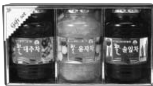
꽃샘5호 꿀대추차, 꿀유자차, 꿀솔잎차 x 1000g