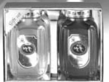
꽃샘프리미엄꽃세트1호 아카시아 1200g / 잡화꽃 1200g