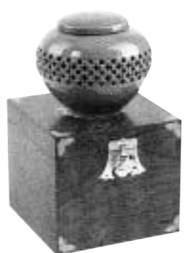
꽃샘토종고기구1호 토종꽃 2400g