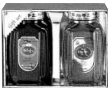
꽃샘기획세트1호 대추꽃차 1200g / 잡화꽃 1200g