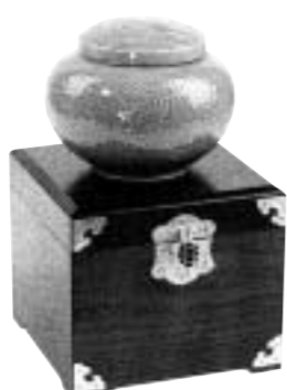
꽃샘특선봉밀1호 잡화꽃 2200g