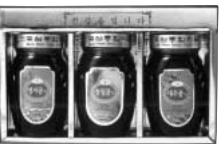
꽃샘4호 영지꽃차, 솔잎꽃차, 대추꽃차 x 600g