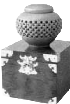
꽃샘토종고기구3호 토종꽃 1200g