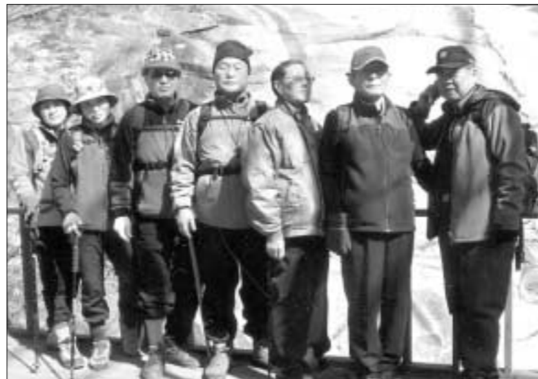
민주평화통일자문회의 포천시협의회는 매월12일을 통일기원 등산회를 실시하고 있다.(사진은 3월13일 명지산 등산 모습)