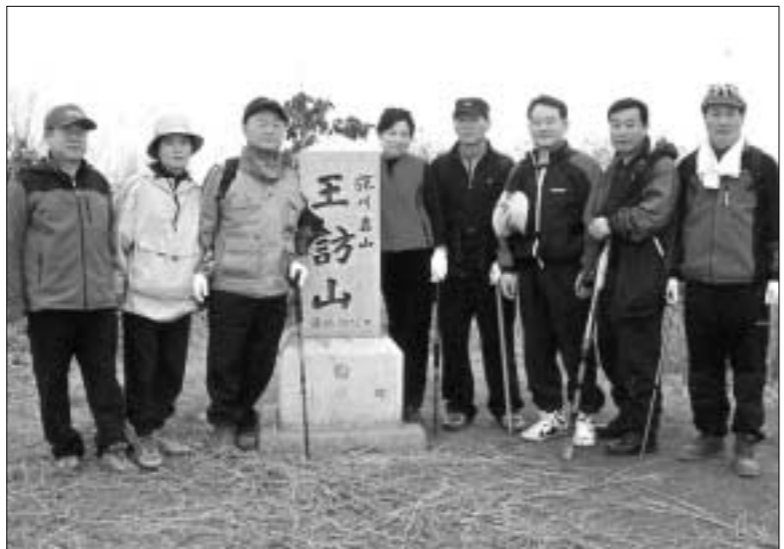
민주평화통일자문회의 포천시협의회는 매월12일을 통일기원 등산회를 실시하고 있다.(사진은 2월13일 명성산 등산 모습)