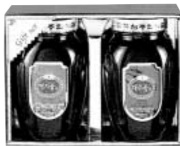
꽃샘꿀차세트 영지꽃차 1200g / 대추꽃차 1200g