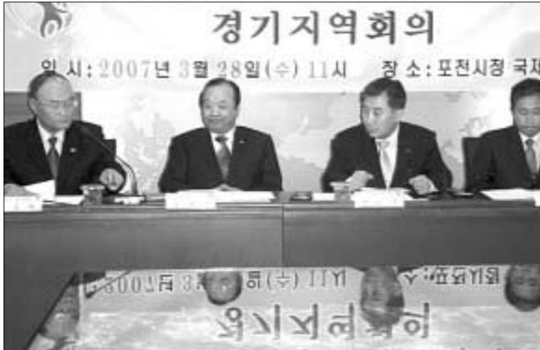
민주평화통일자문회의 포천시협의회는 3월28일 포천시청 국제회의실에서 경기지역회를 개최했다.

민주평화통일자문회의는 대통령 의 통일정책 전반에 대한 전문·건 의 기능을 수행하고 있다. 남북간 교류협력 사업 강화, 인도적 지원 증가, 급강산 유로관광 착수, 철도 ·도로 연결사업 등 급격한 남북간 의 상황변화에 발빠르게 대처하는 탄력적이고 내실 있는 전문·건의 에 힘쓰고 있다.