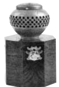
꽃샘고려홍삼꽃세트 홍삼꽃 1000g