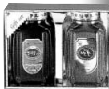
꽃샘기획세트2호 영지꽃차 1200g / 잡화꽃 1200g