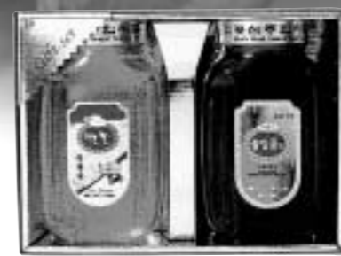
GS기획세트 잡화꽃 1200g / 솔잎꽃차 1200g