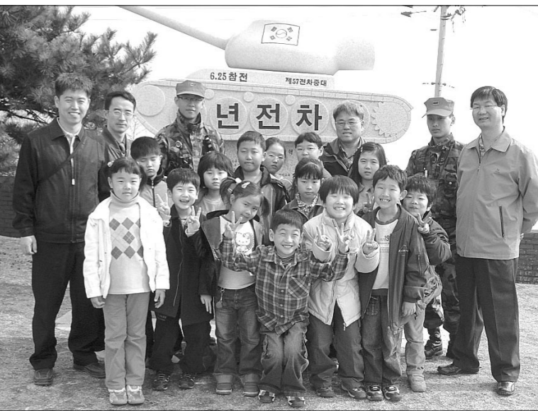
이날 행사에 참가한 적동분교 초등학생들이 태풍전망대에서 기념촬영을 하고 있다.

특히 GOP소초생활관을 둘러보면서 부대 관계자들에게 많은 질문을 하는 등 큰 관심을 보였으며 민족분단의 역사를 한눈에 바라볼 수 있는 태풍전망대를 방문해 순국선열들의 혼이 담긴 전적지를 돌아보며 조국을 지키기 위해 최전방에서 수고하는 군인아저씨들의 고마움