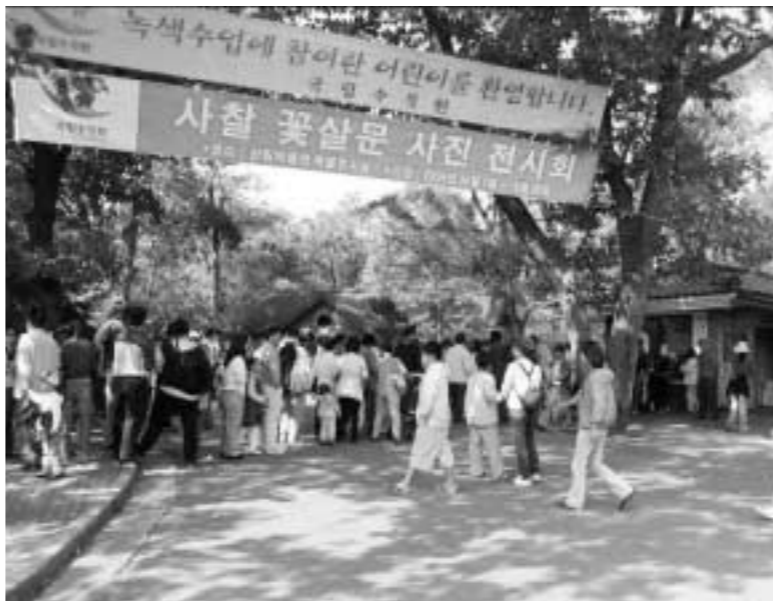
2000) 예약시스템 구축으로 앞으로는 연중(무휴) 예약이 가능하도록 개선했다. 국립수목원은 평일에 한하여 하루 5천명까지 관람할 수 있으며, 예약자에 한하여 선착순으로 입장하고 있다.

산림청 국립수목원은 10일부터 수목원 관람 예약시스템을 변경해 시행한다. 수목원에 따르면 예약만 하고 방문하지 않는 경우가 예약인원의 40%에 달하는 등 예약납음 사례가 빈번함에 따라 예약의 불합리성을 개선하기 위해 예약시스템을 변경해 운영했다. 새로운 시스템은 예약시 입장료를 신용카드로 사전 결제하므로, 예약 후 방문하지 못 할 경우에는 미리 취소해야 납부된 입장료를 반환 받을 수 있게 된다 또 이 제도로 입장료 구입을 위한 매표소에서의 불필요한 대기시간을 줄임은 물론, 취소된 예약인원은 다른 관람 희망자가 방문할 수 있는 기회로 제공되게 된다. 아울러 종전에는 평일 야간(18:00 이후)이나 휴일에는 전화예약이 안 되었으나, 인터넷 www.kna.go.kr 과 ARS(031-540-