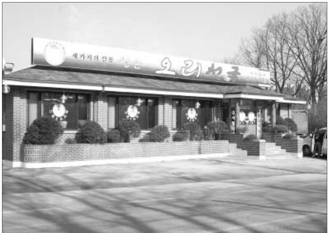
소흘읍 송우리에서 덕정(투바위)방향으로 지나다 보면 배 맞은편에 위치한 신촌오리천국은 전남 나주농장에서 유휴를 먹여 사육한 양질의 오리만을 공급받아 고객들의 식단에 제공하며 유휴오리의 명가로 자리매김 하고 있다.

신촌오리천국은 오전 10시부터 오후 11시까지 양배 명절을 제외하고 연중무휴로 운영되고 있으며 계모임, 친목회, 동창회, 직장회식 등의 장소로 최적이다. 정병갑 기자 jpk61@paran.com