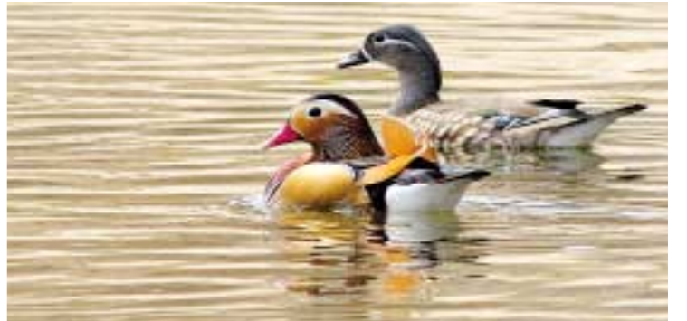
2006.12.29 포천천 (하송우리) 촬영

포천천변에는 이곳이 철새도래지라는 플래카드가 3개 붙어있어 그나마 이곳이 포천의 원앙서식지라고 알고있을 정도입니다. 게다가 하천변에는 몇몇 낚시꾼들의 모습이 보이는 등 원앙과