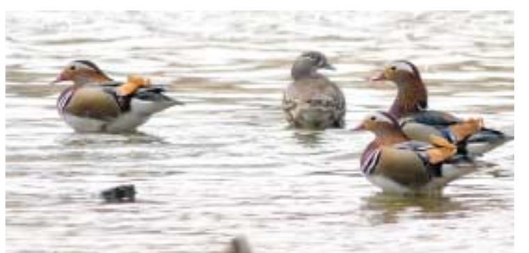
2006.12.29 포천천 (하송우리) 촬영

겨울 철새들이 안전하게 서식하기에는 바람직하지 않은 현상들이 발견되기도 합니다.