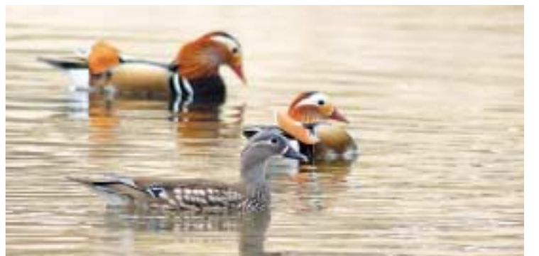
2006.12.29 포천천 (하송우리) 촬영