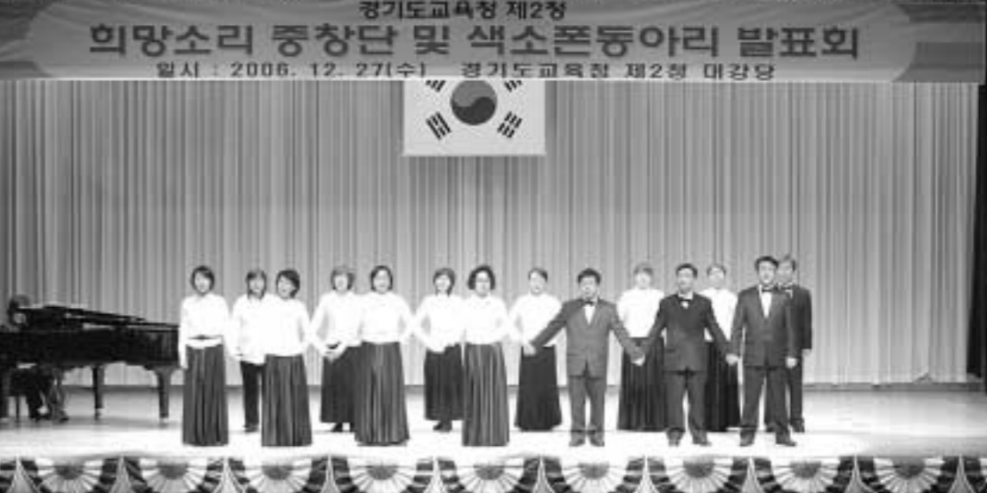
경기도교육청 제2청 희망소리 중창단 및 색소폰 동아리 발표회 일시 : 2006. 12. 27(수) 경기도교육청 제2청 대강당