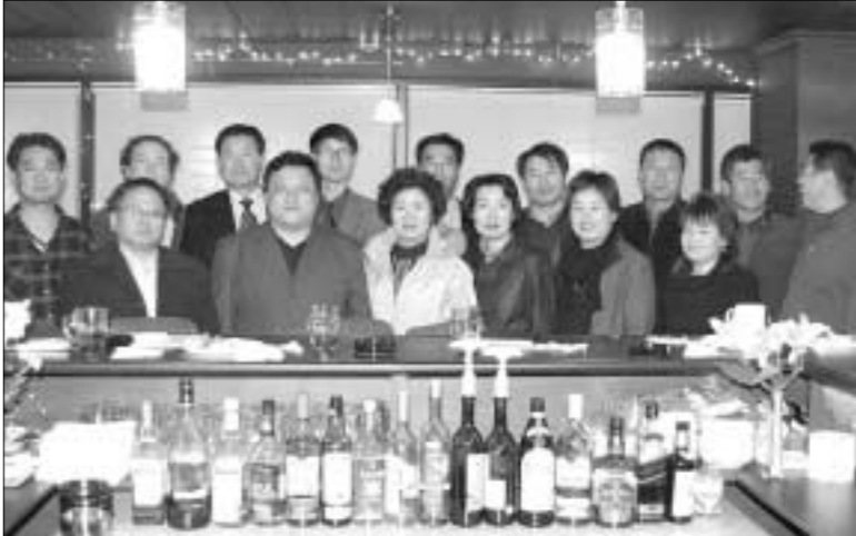
한내울포럼이 1월5일 첫 번째 모임을 갖고 출범을 선언했다. 소흘읍 송우리에서 개최된 첫 번째 모임에는 각 분야의 전문가 15명이 참석했다.