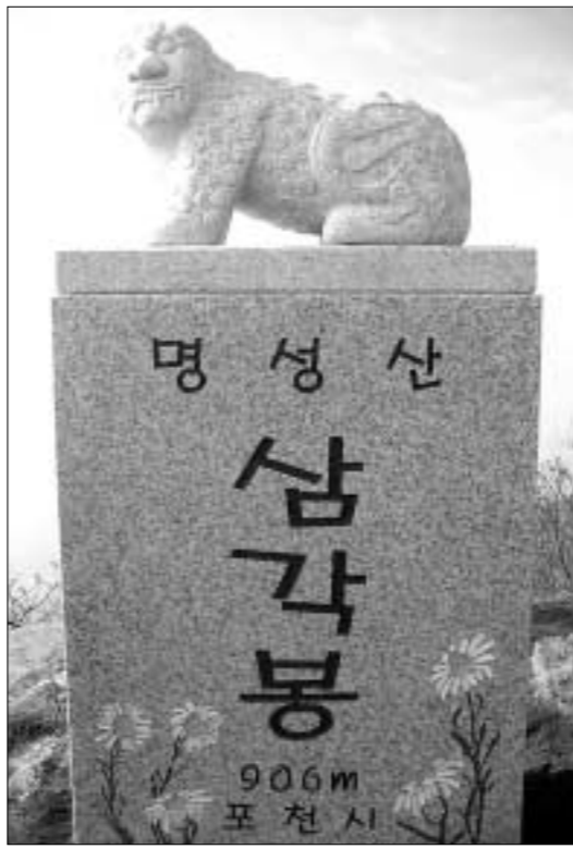
포천시는 명성산 정상과 620m 떨어진 삼각봉에 해태상을 설치했다.

뾰족한 봉우리를 발견하고 그곳에 G.P.S를 찍어보니 화면상에 삼각봉이라는 글씨가 나타났으며, 이를 통해 비로소 삼각봉의 정확한 위치를 찾을 수 있었다고 밝혔다. 다시 찾은 삼각봉 바로 아래에는 동양 최대 규모인 승진종합훈련장이 있어 매년 사격훈련으로 인해 산불이 자주 발생해 왔는데, 포천시는 이번 기회에 산불예방을 염원하는 뜻에서 화재를 물리치는 신수(神獸)인 해태상을 조각하고 경기소방본부로부터 까모프 헬기를 지원 받아 좌대와 함께 이를 삼각봉에 설치했다. 포천시는 앞으로도 잘못 알려진 산 정상과 봉우리의 위치를 정확히 찾는 작업을 지속적으로 실시해 등산객들에게 올바른 지리정보를 제공하는 한편, 산 자체를 관광자원화하는데 남다른 열의와 관심을 기울이겠다고 밝혔다. 김영복 기자 best114@paran.com