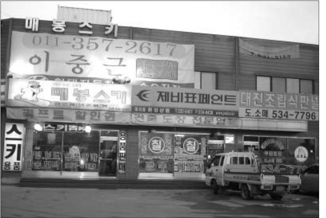
건설화학공업(주) 제비표 페인트는 인간과 자연을 생각하는 친환경 페인트를 생산, 전국에 분포되어 있는 수많은 대리점에 물량을 공급하고 있는 굴지회사다.

문의 Tel 031)533-8407, Hp 010)9566-8408 정병길 기자 jpk61@paran.com