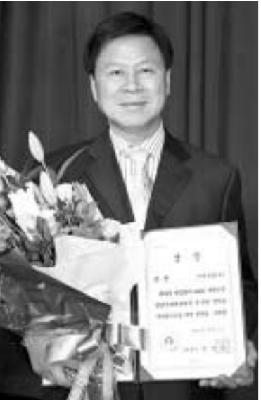
12월7일부터 11일까지 5일간 서울 COEX 태평양홀에서 개최된 2006년 대한민국발명특허대전에서 국제산업(주)가 은상을 수상했다.

12월7일부터 11일까지 5일간 서울 COEX 태평양홀에서 개최된 2006년 대한민국발명특허대전에서 국제산업(주)가 은상을 수상했다. 대한민국발명특허대전은 특허청이 주최하고 한국발명진흥회가 주관한 행사로 기계금속과 전기전자, 섬유화학 등 8개 분야의 신기술 제