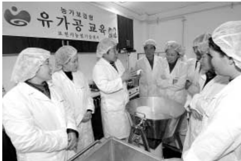
포천시는 낙농가의 일여유 해 소와 유가공 기술보급을 위해 농업기술센터 농가보급형 유가공실에서 여성 낙농인을 대상으로 치즈제조 교육을 실시했다.