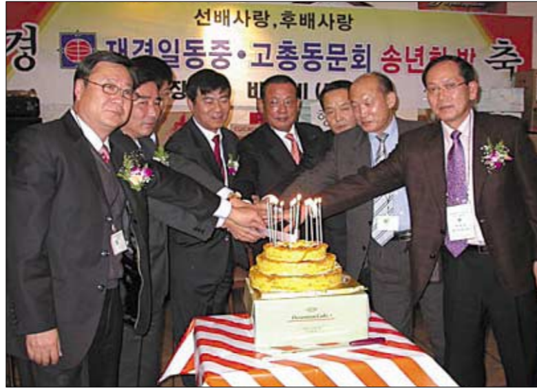
재경일동중·고동문회는 12월2일 여의도에서 300여명의 동문이 참석한 가운데 2006년 송년의 밤을 개최했다. 일동중·고에 장학금을 지원하고 계기를 마련하고 있다.