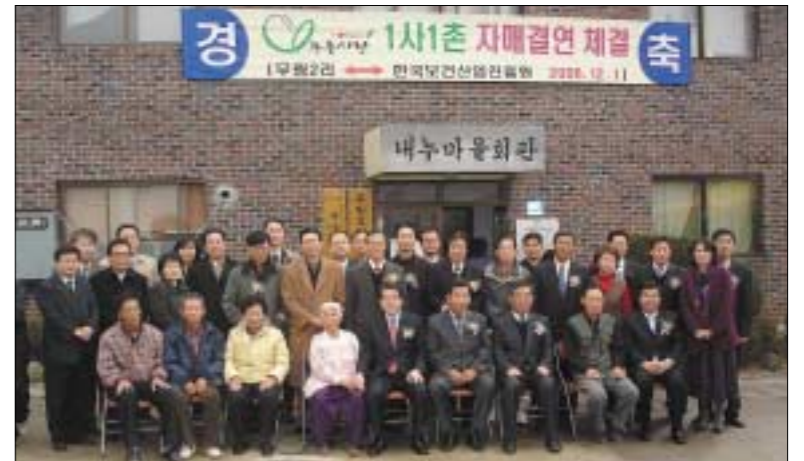
포천시 소흘읍 무림2리와 한국보건산업진흥원이 1촌1사 자매결연식을 갖고 교류활동을 추진해 나가기로 했다.