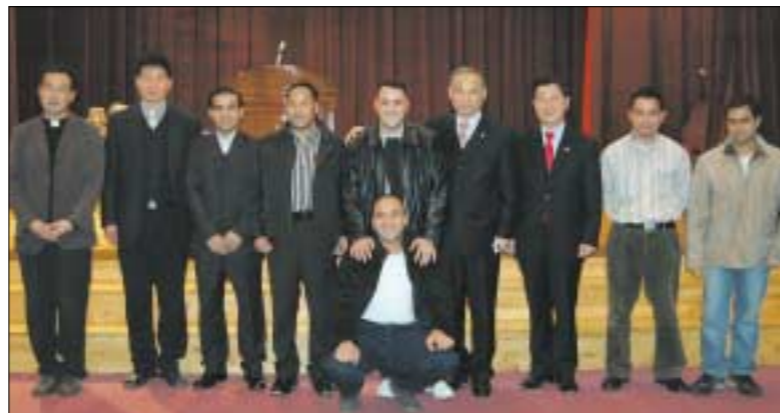
성공회 포천나눔의 집 과 평화의 집이 공동주최하고 포천시가 후원하는 제3회 포천시 이주노동자 송년잔치가 12월10일 오후6시 포천여성회관에서 300여명의 이주 노동자들이 참석한 가운데 개최됐다.

좋은 사람들도 있다"고 전제하고 "내년에는 더욱 좋은 일들이 있기를 기대한다"고 밝혔다. 방글라데시 대표는 "인간이 태어날 때는 모든 사람이 보면서 웃고 있는데 태어나는 아기가만 울고 있다"는 사실을 상기시키며 "내 자신이 고통스럽더라도 남에게 웃음을 줄 수 있는 사람이 될 수 있기를 바란다"고 말했다. 이날 이주노동자들은 단속이 심해 외부출입이 어려운 가운데 이번 행사에 참여할 수 있었다며 좀더 나은 환경이 되었으면 좋겠다는 의견을 밝히기도 했다. 인사말에 이어 각국을 대표하는 문화예술 행사가 열려 음악과 노래와 춤이 이어졌으며 스리랑카, 네팔, 이집트, 방글라데시 등 7개국에서 온 이주노동자들이 참석했다. 김영복 기자 best114@paran.com