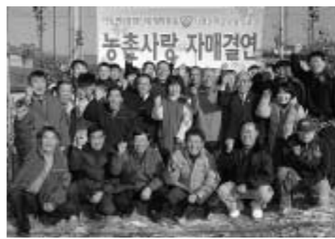
자매 마을과 원들이 함께 기념촬영을 했다.

장 6리는 190대 새마을운동 창기에 집주이성면서 일명 '개미마을'로도 불려왔으며, 주민들은 주로 농업에 종사하면서 청정미와, 사과 등을 생하고 있다. 또 마을에 운동기구가 있어 등들이 많이래하는 지역이기도 하다.