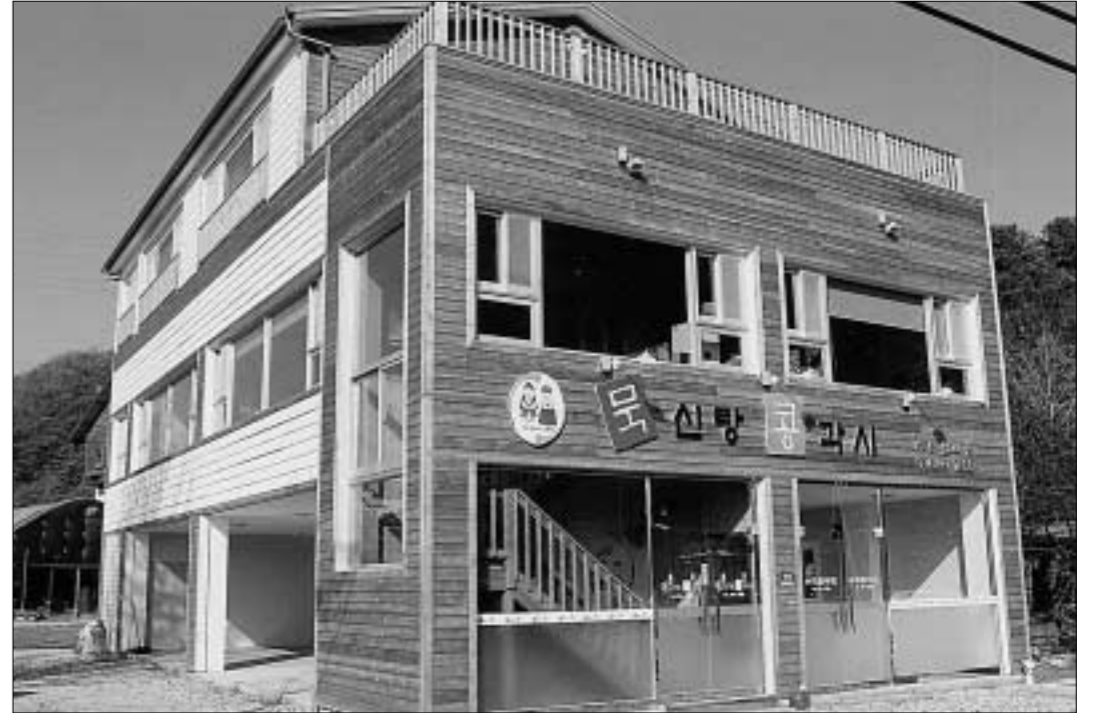
행복을 나눠먹는 그 집, 그 맛, 그 추억이란 문구가 돋보이는 목신랑 콩각시는 도토리묵과 두부를 이용해 고객의 입맛에 맞는 다양한 요리를 선보이고 있다.