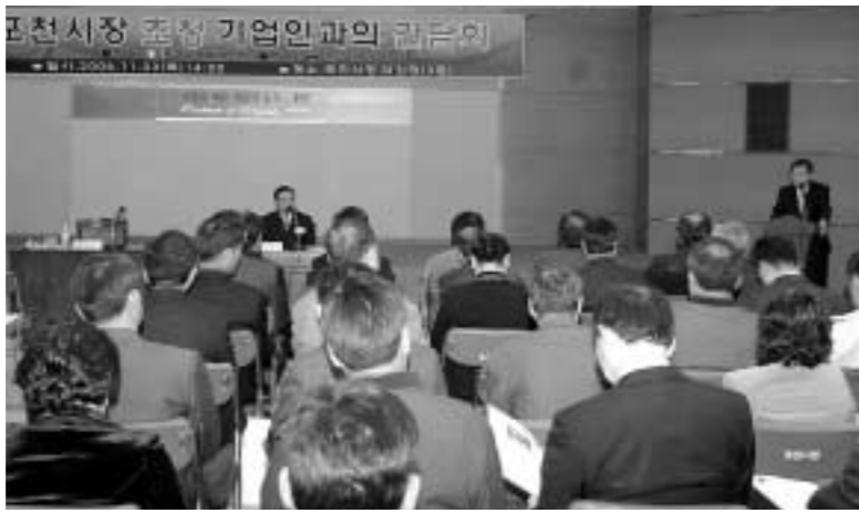
박운국 포천시장(오른쪽)이 기업인들과의 간담회에서 질문에 답변하고 있다.

박 시장은 이날 인사말을 통해, 지역경제 활성화를 위해서는 기업의 투자확대와 일자리 창출이 관건인 만큼, '기업하기 좋은 환경'을 만드는 데 최선을 다하겠다고 밝혔다.