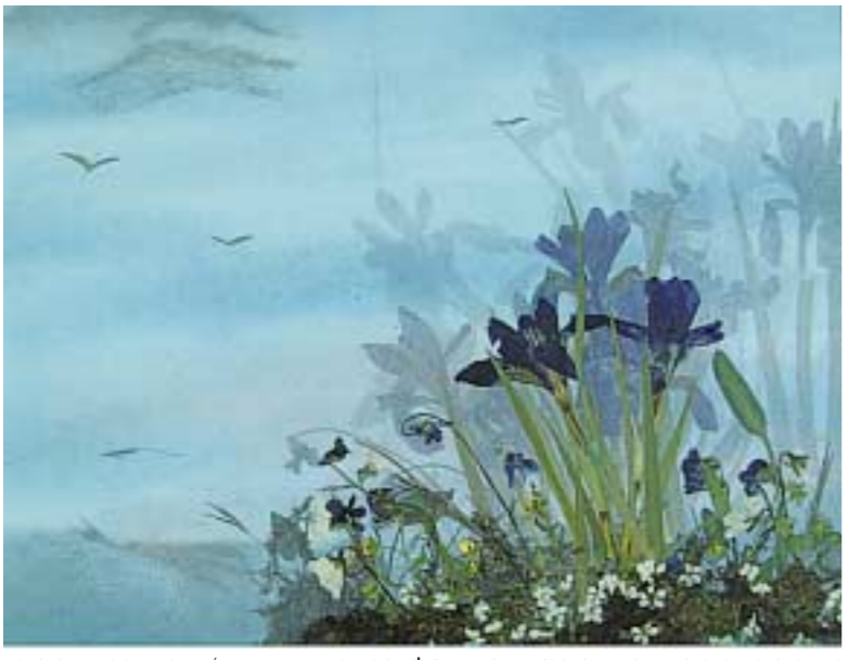
산림청 국립수목원은 '2006 꽃누르미 예술전'을 11월 20일부터 11월 30일까지 산림박물관 특별전시실에서 개최한다.

산림청 국립수목원(원장 권은오)은 20일부터 11월 30일까지 산림박물관 특별전시실에서 개최한다.