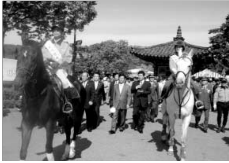
지난 13일 과천 서울랜드에서 열린 제9회 119대축제 개막식에서 포천소방서 말에 탄 기마순찰대원이 김문수 경기도지사와 함께 입장해 눈길을 끌었다.