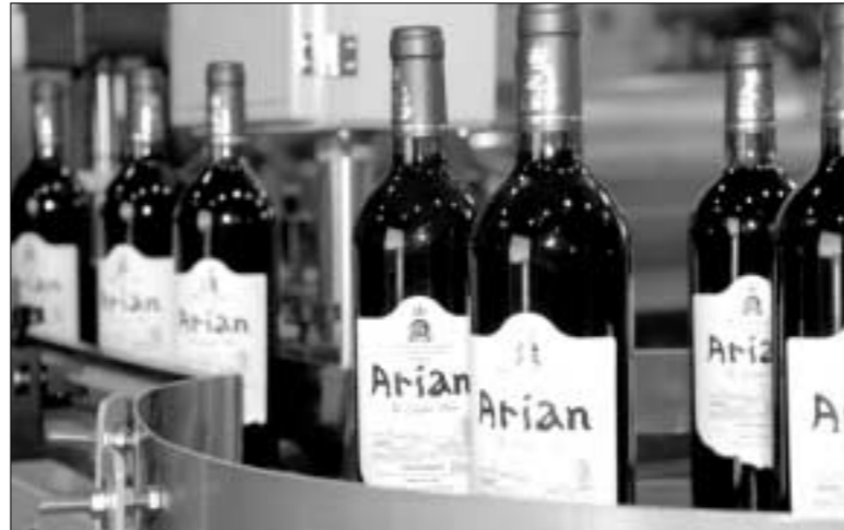
포천시 포도주 및 포도즙 가공공장 준공. 가산면 우금리에 소재한 가공공장에서 포도주가 생산되고 있다.