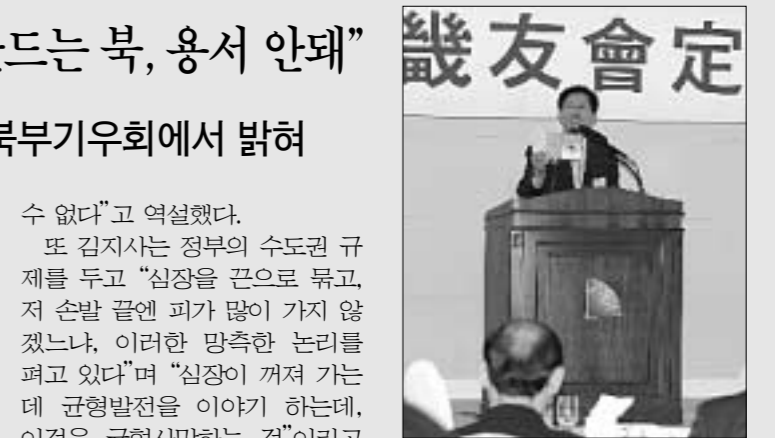
신 박바로 차리면 곱감을 뺏어 먹을 수 있다"고 강조했다.

김지사는 이어 북핵실험과 관련해 "아무쪼록 우리 북부지역에 악조건"이라며 "북한의 핵폭풍이 물러오는 악조건 속에서 정신을 차리자, 호랑이한테 잡혀가도 정