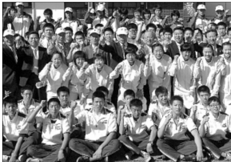
김문수 경기도지사가 12일 경기도청 운동장에서 열린 '제87회 전국체전선수단결단식'에서 체전 참가 선수단들과 화이팅을 외치고 있다.

이번 전국체전은 경북 김천과 일대에서 17일부터 23일까지 열리며 경기도선수단은 1,800여명이 참가한다. 김영복 기자 best114@paran.com