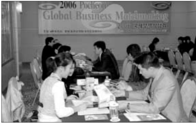
포천시는 10월10일부터 18일까지 아도니스 호텔 전시장에서 2006포천국제무역상담회를 개최했다.

한편 포천시 관계자는 "이번 무역상담회 참가 해외 바이어가 적었던 원인은 최근 이슈로 대두된 북한 핵실험과 관련, 예정된 바이어들이 참여하지 않았기 때문"이라며 "무역상담회를 활성화시키기 위