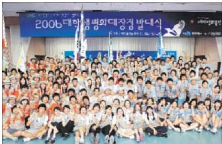
경기도는 8월9일 오전 도청회의실에서 원유철 정무부지사 등 대학생 150명이 참석한 가운데 평화대장정 발대식을 가졌다.

도착한다. 이번 대장정 주요내용으로는 DMZ 접경지역 도보행진으로 분단역사와 현실을 느끼고 배우는 평화·역사 체험행사에 이어 DMZ내 환경생태 체험·확인행사 등을 병행 실시한다. 원유철 정무부지사는 이날 인사말을 통해 "2006 평화대장정을 통해 깨달음의 시간이 되고, 우정을 쌓는 화합의 시간이 되어 자신의 미래와 나라의 미래를 생각하는 계기가 되기를 기대하면서, 대장정을 무사히 마치고 건강한 모습으로 돌아오시기 바란다"고 밝혔다. 김영복 기자 best114@paran.com